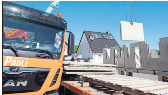
Im firmeneigenen Lkw angeliefert schwebt hier ein Doppelwand-Element auf die Baustelle. Mit den Fertigdecken, die täglich bei Pauli gefertigt werden, kann man bis zu 15 Einfamilienhäuser bauen.