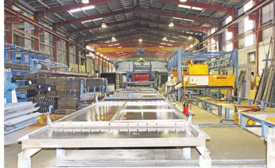
In der Fertigungshalle der Baustoffe Pauli GmbH entstehen Betonfertigteile als Doppelwände, Fertigdecken, Treppen, Winkelmauern und Spaltenböden.