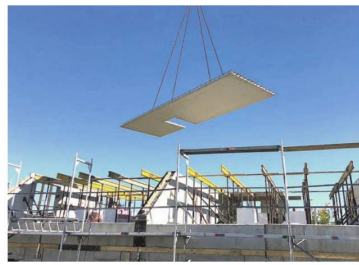
Mit einem Kran werden die fertigen Betonwände und -decken im Bau platziert.

Dazu gehört unter anderem der Anspruch, dass in den Büros jederzeit Ansprechpartner für